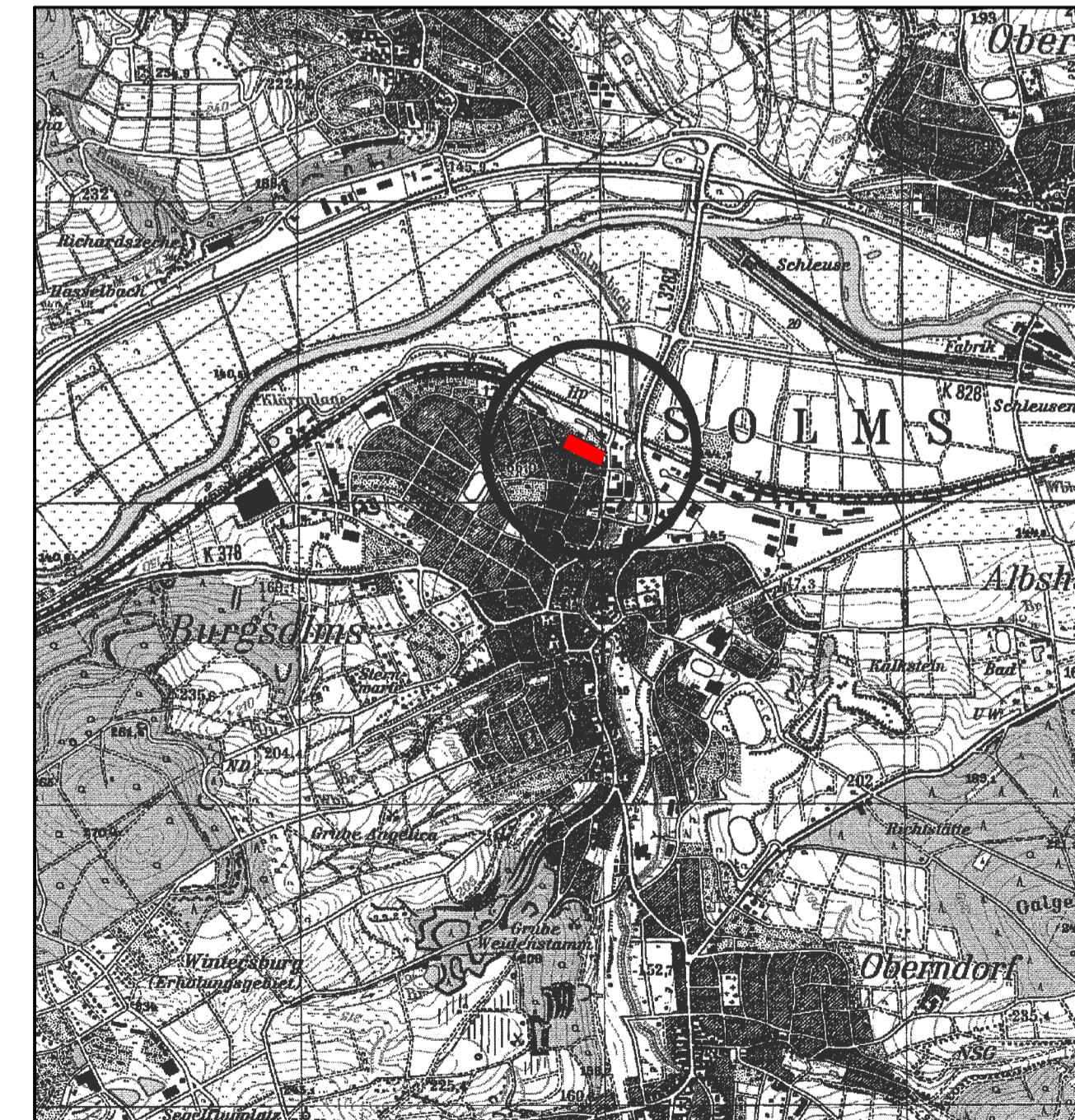
Übersichtskarte (Maßstab 1 : 25.000)

Solms, den _____ Bürgermeister Solms, den _____ Bürgermeister