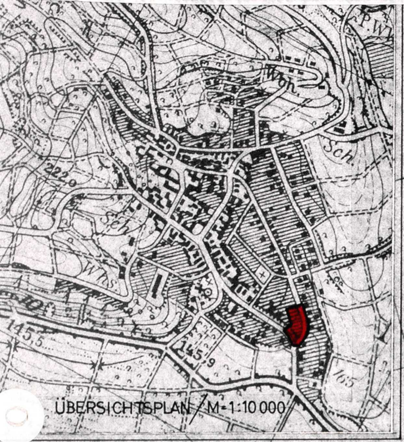
ÜBERSICHTSPLAN M=1:10 000